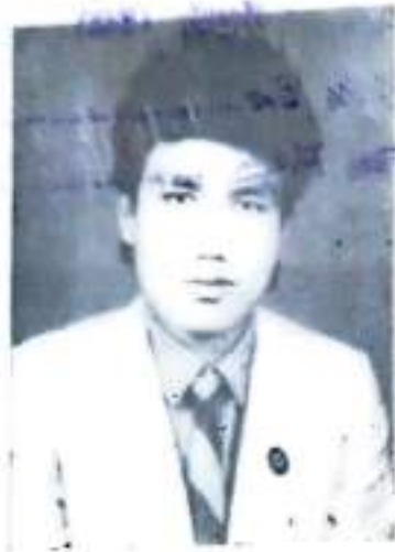
শক্তিশালী মানৱ মুনাল কাহ্নি পাঠক