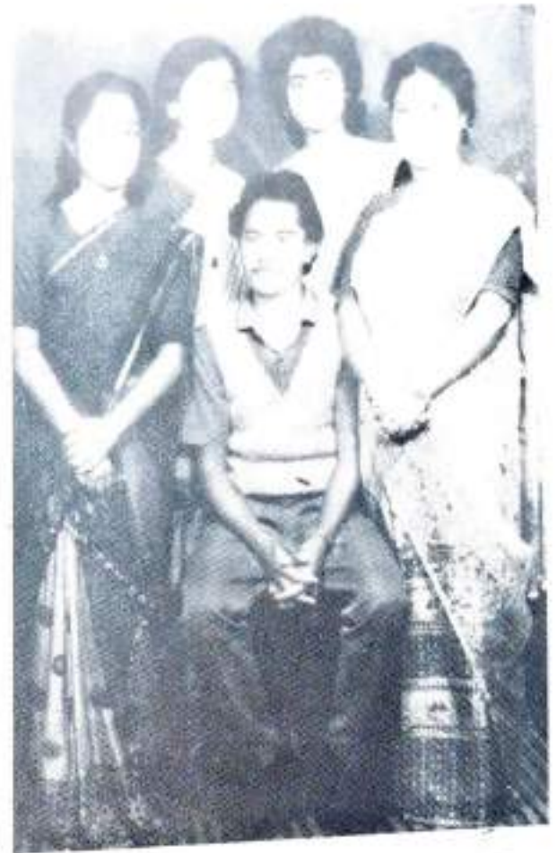
শ্রেষ্ঠ নাট্যদল নাটক : মহান আত্মার জীয়া ডিগ্রন বাণফালের পবা খিটাই— মিচ বীমা কলিতা, স্বপ্না দাস, কণাঙ্কলী ওনা, কবিতা দাস, আক বহি— কমল হালুকদার ( পরিচালক )